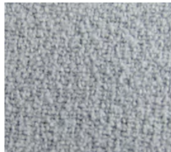
Détail côté grattant :