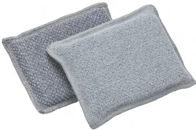
Détail côté doux :