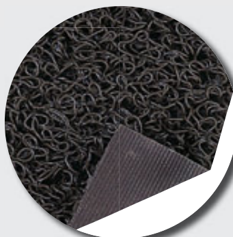
Thibaude pleine (10 mm)