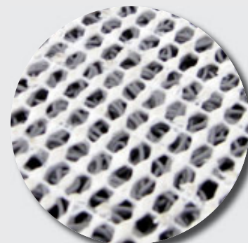
Thibaude ajourée (14mm)