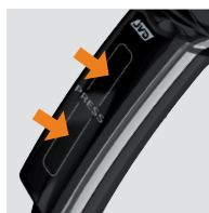
SYSTÈME DE POIGNÉE INTERRUPTEUR BREVETÉ