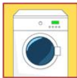
Lavable en machine