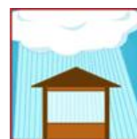
Extérieur sous abri