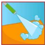
Jet haute pression