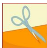
A la coupe