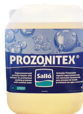
PROZONITEX ACTIVATEUR POUR EAUX OZONÉES Bidon de 11 kg Réf 120652