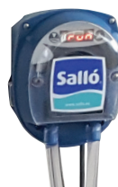
DOSEUR PERISTALTIQUE Réf 120651