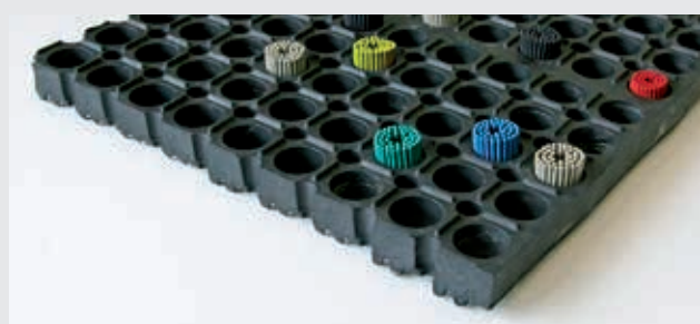
M26 + brosses