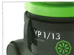
ATTACHES FLEXIBLES ET RÉSISTANTES