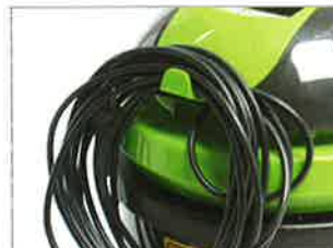
CROCHET POUR CÂBLE