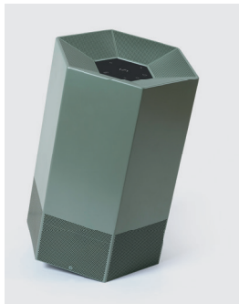
Vert Malachite RÉF. 8 77 2127-GR