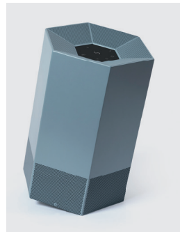
Bleu Saphir RÉF. 8 77 2127-BL