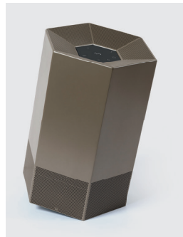
Bronze RÉF. 8 77 2127-BR