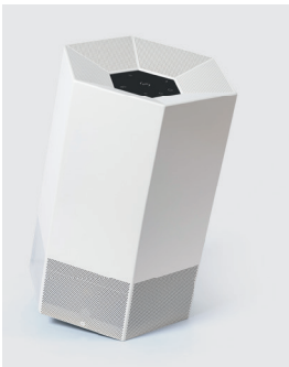
Blanc crème RÉF. 8 77 2127-WH