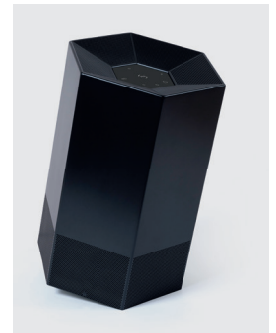
Noir mat RÉF. 8 77 2127-BK